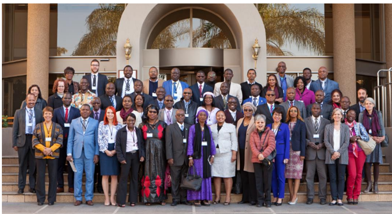
Participantes en el Taller de Windhoek de la redPEA